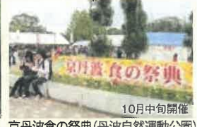
京丹波食の祭典(丹波自然運動公園) 10月中旬開催