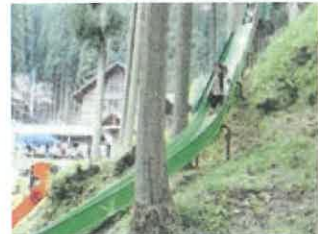
すべり台もあるだも♪