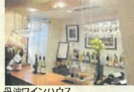
丹波ワインハウス