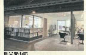
観光案内所(道の駅「丹波マーケス」うるおい館内)