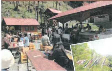
GWに鐘乳洞まつりだも♪