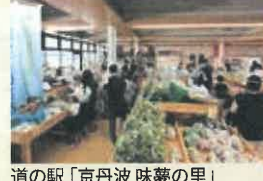
道の駅「京丹波 味夢の里」