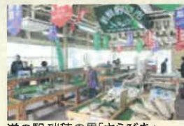
道の駅 瑞穂の里「さらびき」