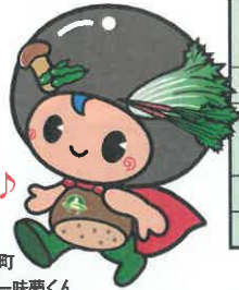
京丹波町 食のキャラクター 味夢くん