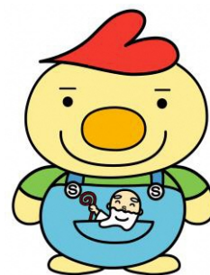
社協キャラクター こたん