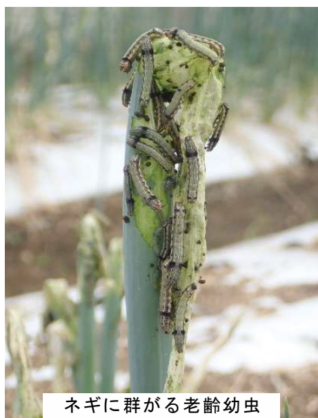
ネギに群がる老齢幼虫