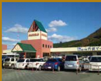
道の駅「丹波マーケス」 京丹波町須知 ☎0771-82-3180