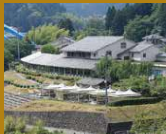
道の駅「和(なごみ)」 京丹波町坂原 ☎0771-84-1008