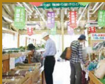
道の駅「瑞穂の里さざびき」 京丹波町大朴 ☎0771-88-9350