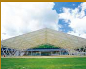
道の駅「京丹波 味夢の里」 京丹波町曾根 ☎0771-89-2311