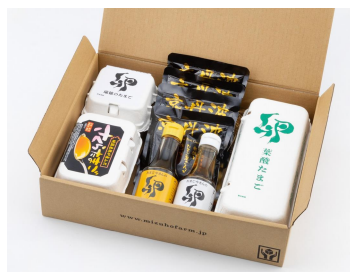
有限会社 みずほファーム