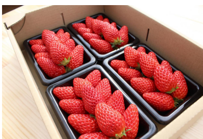
株式会社 京都誠志郎農園