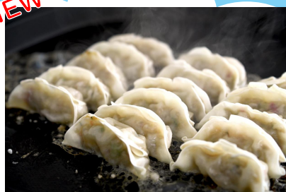
株式会社岸本畜産