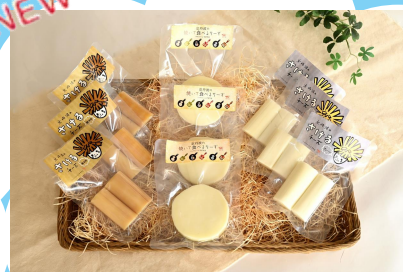
株式会社 ミルクファーム すぎやま