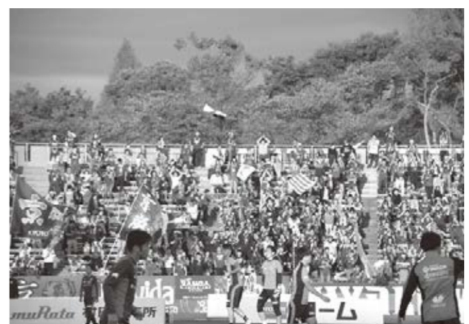
昨年の応援デーの様子