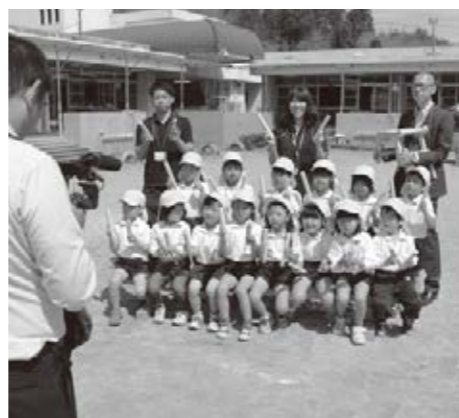
ケーブルテレビの「火の用心CM」撮影に挑む園児

この日、町ケーブルテレビの職員が須知幼稚園を訪れ、ケーブルテレビでおなじみとなっている「火の用心CM」の撮影が行われました。園児たちは拍子木を手にする