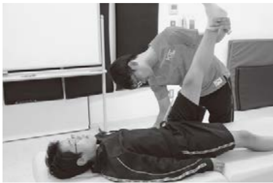
ジュニアアスリート育成プロジェクトの体力測定の様子

参加児童は、前期(5月から9月)、後期(11月から2月)の2回に分けて1期あたり計12回の講習