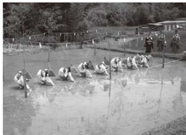
神撰田で苗を手植えする早乙女

須知高校生が町議会で学習成果を報告 私たちが取り組んでいること 須知高校の教育振興の一環として6月7日、同高の生徒7人が学習成果を京丹波町議会で報告しました。 報告は、生徒の学習成果を広める機会として、起業家から起業のノウハウを学ぶ起業家教育プログラムを受けた生徒や、探求学習ゼミで本町の人口減少の課題解決に取り組んだ生徒、硬式野球部の生徒らが、町議会議員