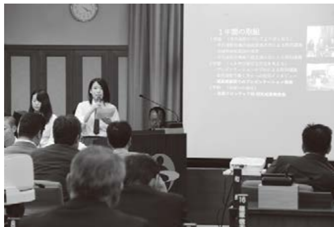
活動成果を発表する生徒