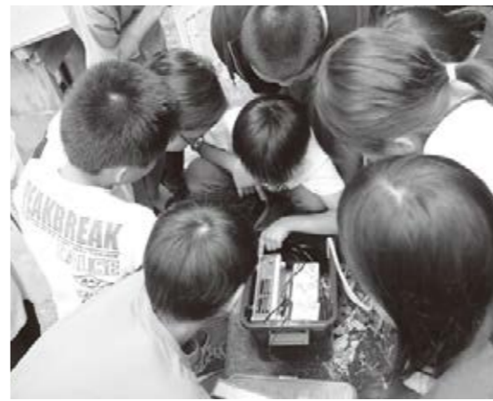
満点地震計のメンテナンスをする児童たち

この日は、講師に同研究所の矢守克也教授と大学院生3人を招き、5年生9人が地震の仕組みや校内に設置されている地震計について学