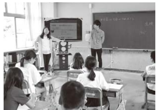
地震について授業をする大学院生