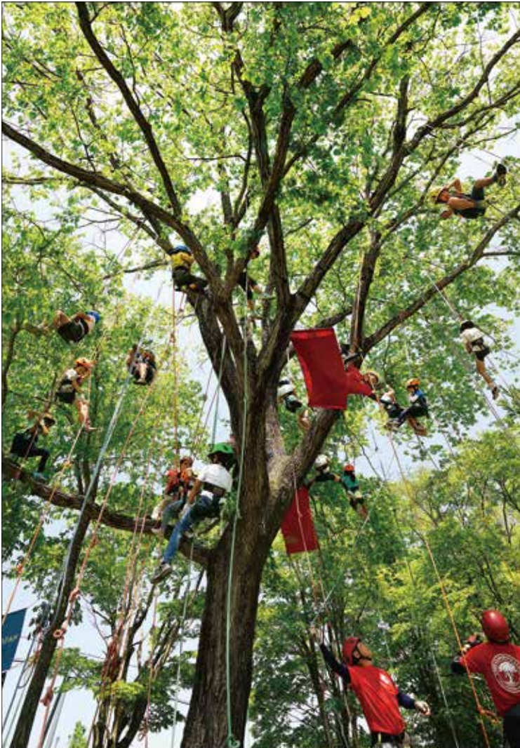
特選 京丹波町長賞「ツリークライミングは楽しいよ!」 白木 勇治さん(福知山市)