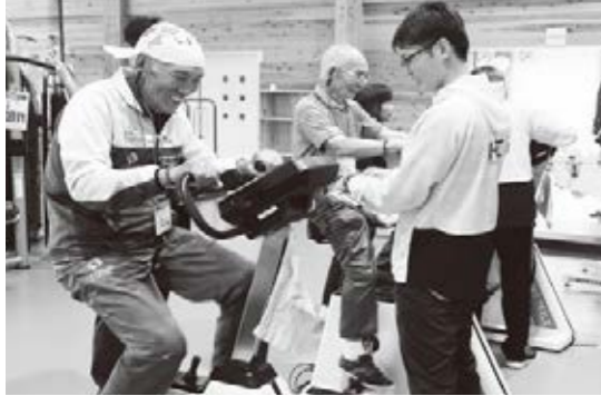
健康・体力づくり検証プロジェクトの様子

基本講習を受け、各自のペースで同施設の機器を使ってトレーニングを行います。5月からの第1期生として10人が取り組んでいます。