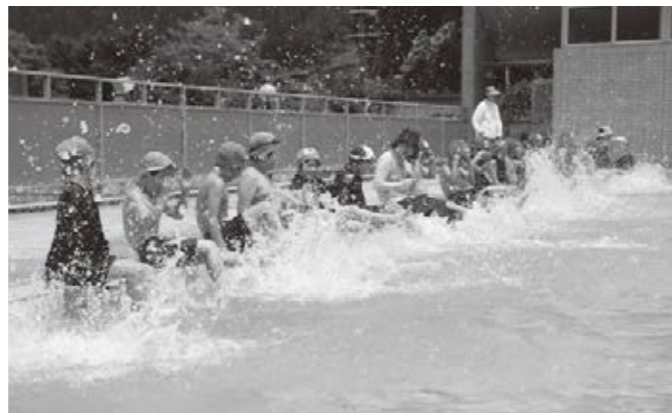
水しぶきに歓声をあげる児童たち

20日には、3、4年生の初めてのプールの授業が行われ、水しぶきに歓声をあげました。この日は気温28度、水温24.8度で、晴天に恵まれたプール日よりとなり、水中ジャンケンや宝探しゲームを楽しみました。