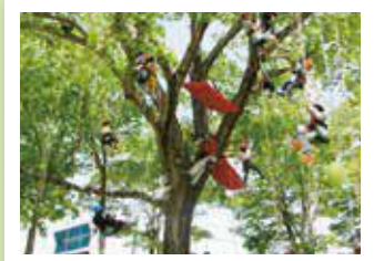
府立丹波自然運動公園はジュニアアスリートの養成から、家族、地域の交流、スポーツの拠点、交流の場として幅広く利用されています。