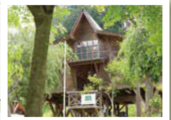
ウディバルわちは上和知川の清流沿いにある木の香り豊かな宿泊施設でキャンプ・川遊び・バーベキューなどができます。