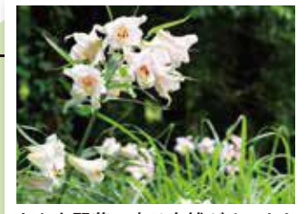
わち山野草の森は自然がそのまま公園になったオアシススポット