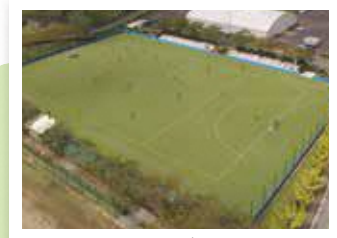
グリーンランドみずほは、グラウンド・ゴルフやホッケーなどの利用でにぎわいます。国道173号に面した道の駅「瑞穂の里さらびき」を運営しています。