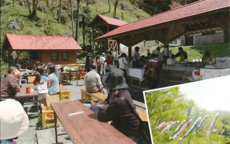
GWに 鍾乳洞まつりだム♪