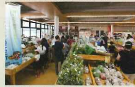
道の駅「京丹波 味夢の里」