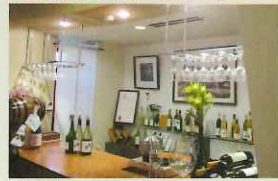
丹波ワインハウス