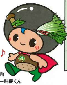
京丹波町 食のキャラクター 味夢くん