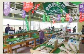
道の駅 瑞穂の里「さらびぎ」