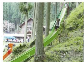
すべり台もあるだム♪

洞窟がどこまで続いているのが調べるために鶏と犬を放したら、鶏が3キロ離れた隣の集落の大原神社(福知山市三和町大原地区)の近くの洞穴に出たという伝説があるんだム♪