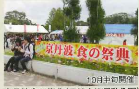
京丹波食の祭典(丹波自然運動公園) 10月中旬開催