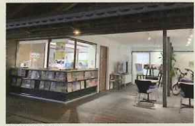
観光案内所 (道の駅「丹波マーケス」うるおい館内)