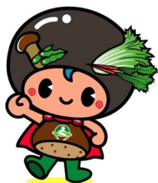
あじむ 京丹波 味夢くん