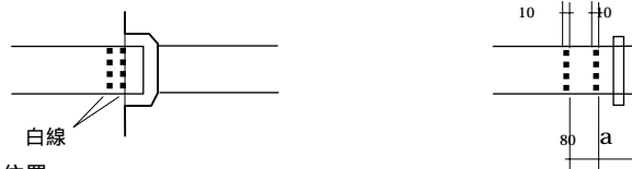
挿し口白線の位置